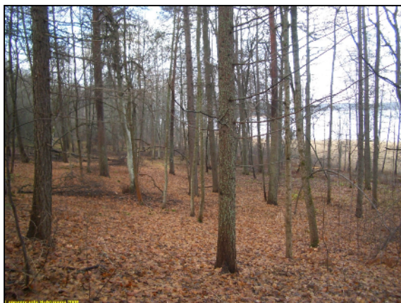
Alueen itäisimmän osan rantaa