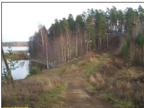
Taustalla leirintäalueen rantaa, oikealla (ja kuva alh.) vanha hyppyrimäen monttu.