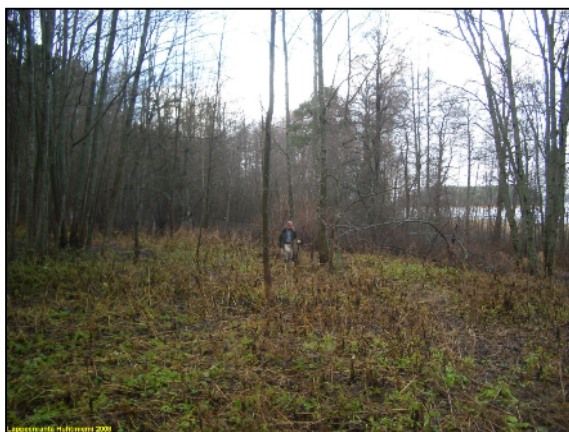
Itänsan lehtometsäistä alemmaa rantaterassia

olisi esihistoriallisia asuinpaikkoja tms. teimme kuitenkin törmän laen reunalle (jossa maaperää ei ole muokattu) joitain koekuoppia havaitsematta niissä mitään esihistoriaan viittaavaa. Leirintäalueen itäosassa korkea törmä hieman loivenee ja maaperä on kivetöntä hiekkaa. Tämä osa alueesta on kuitenkin varsin muokattua: erilaisia resentejä kuoppia ja kuopanteita, mökkejä. Leirintäalueen itäpuolella em. törmän lakialue on rakennettua emmekä nähneet mitään syytä tutkia sitä aluetta silmänvaraista tarkemmin. Leirintäalueen kohdalla rantatörmä laskee lähes suoraan Saimaaseen, eikä kivikoisessa ja muokatussa rannassa ole sellaista